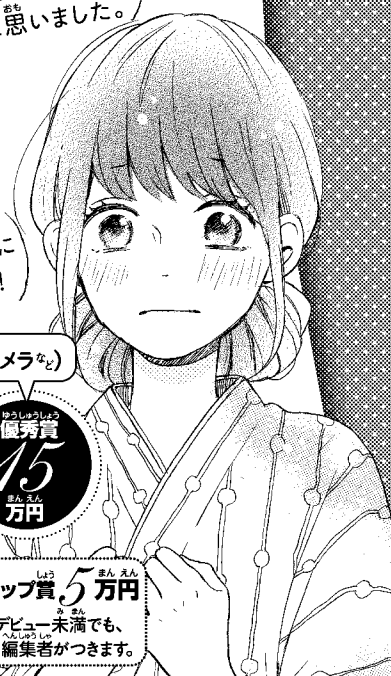
イラスト:藤もも「恋わずらいのエイ」より