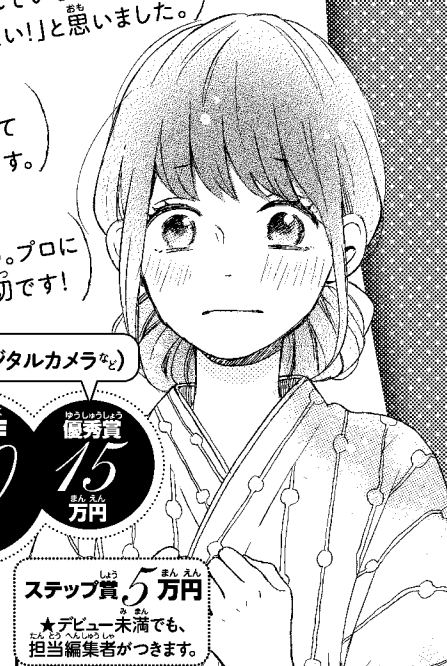
イラスト:藤もも「恋わずらいのエイ」より