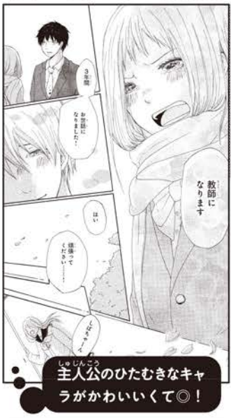
主人公のひたむきなキャラがかわいくて◎!

第37回デザート新人まんが大賞にたくさんのご応募をいただき、ありがとうございました! 今回は2人がデビュー、2人がステップ賞です!