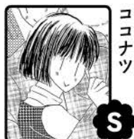
「同棲日和」 ココナツ