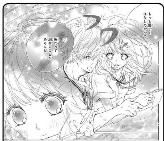
illustration 絵・キャラ 人物の絵はよくなっています。今回の作品では時間がなかったせいか、デッサンの狂いが目立ちます。かわいい、カッコいい初霜さんの絵柄だからこそ、デッサンがしっかりすればもっと魅力が増すはず。またトーンの量が全体的に多いところも気になります。画面のバランスを意識して。