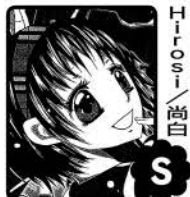
「ブリクル」 Hiroshi / 尚白