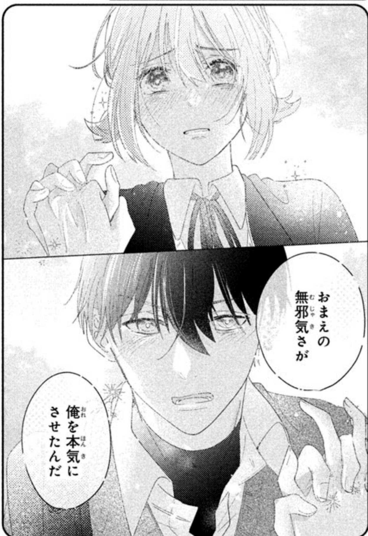
こんな風に見つめられたら…。2人の表情が相まってラストの盛り上がりもキュンキュンでした!