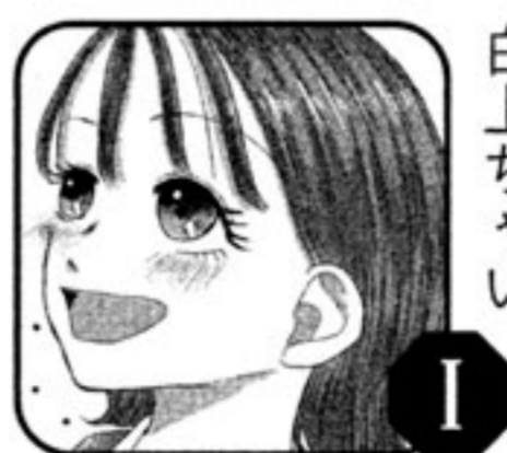
「結南ちゃんと颯先輩のお菓子物語」 白上ちやい