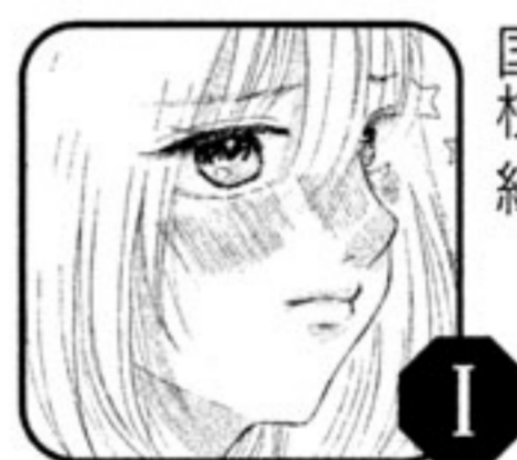
「素直じゃない二人」 国枝縁