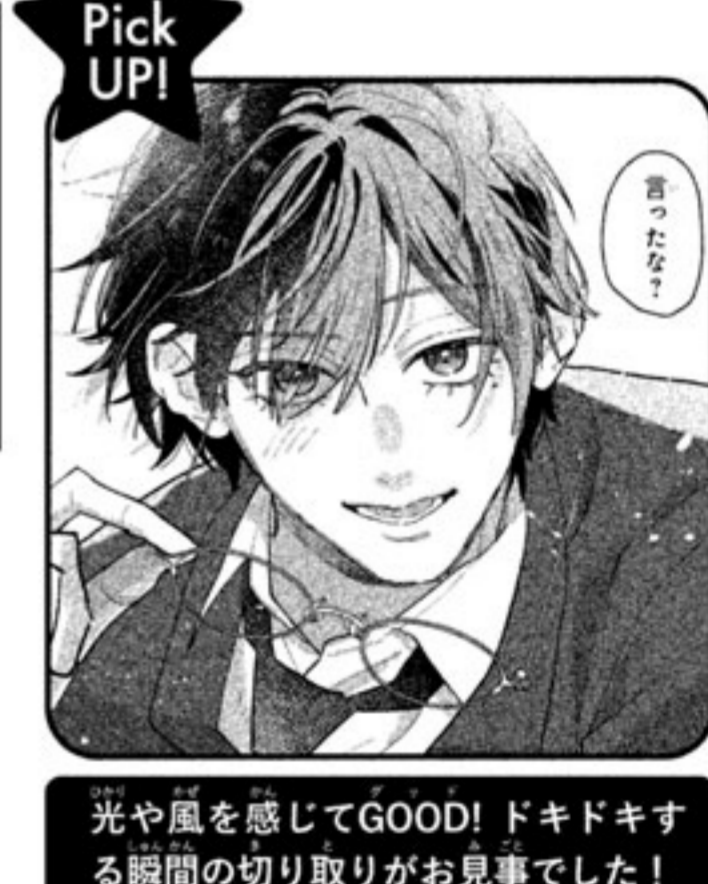
光や風を感じてGOOD! ドキドキする瞬間の切り取りがお見事でした!

絵・キャラ ギャル特有のしゃべり方やハイテンションな主人公のキャラクターがかわいらしかったです。また、ヒーローの仲良くなるというグイグイ迫ってくる一面にもときめきました。ただ、彼の二面性に前振りがなく、ヒーローのギャップが唐突に見えてしまったのが惜しい。どんな人物なのか深掘ってみよう。