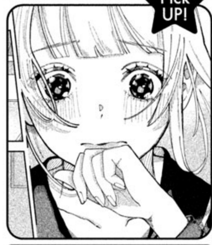
瞳の表現や風の使い方にも工夫があり♡ トキメキ120%です♡

絵・キャラ 恋をする女の子の表情がとにかくかわいい! 気持ちの高まりを瞳、髪の毛、まつげ、服や風まで画面の全てを使って表現しようとしていて素晴らしいです。課題はキャラ作り。2人がこのお話に至るまでにどんな距離感で過ごしてきたのかという部分まで考えられるとより厚みのある人物像に!