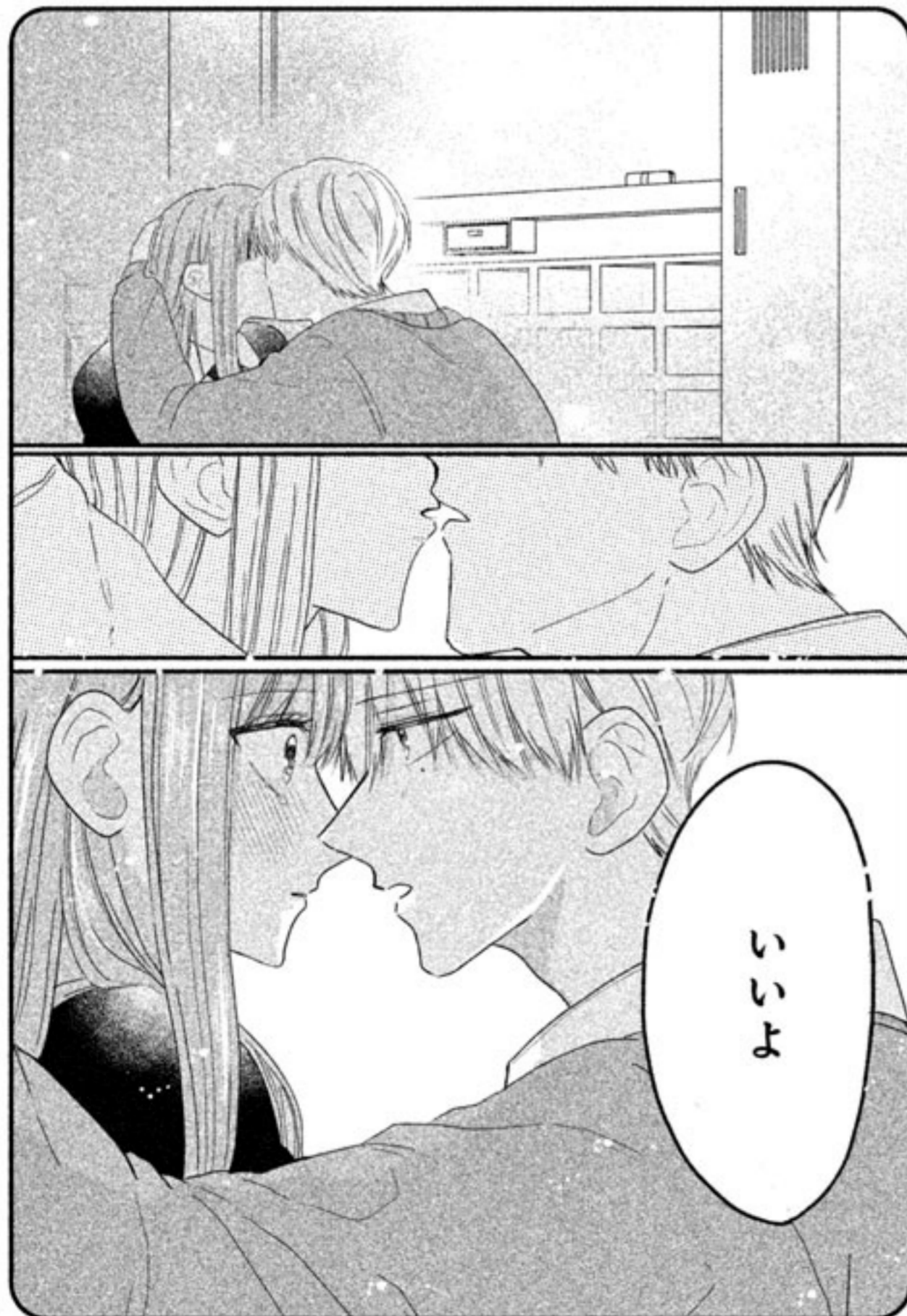
最高のキスシーンでした…!!