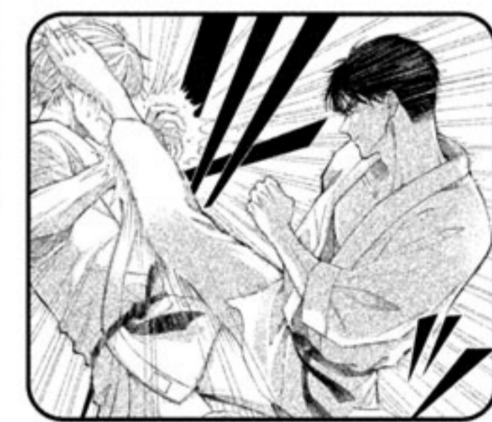
空手シーンの説得力がすごい!

絵・キャラ 空手シーン、見開きハグなど、絵に魅せられるところが多く、パワーを感じる画面で良かったです。特に今回は体格差が最高でキュンとしました! 女子が少し硬く見えちゃうのと、顔まわりがシンプルに感じちゃうので、髪と表情の表現をさらに研究して、より伝わるシーンを目指してみよう!